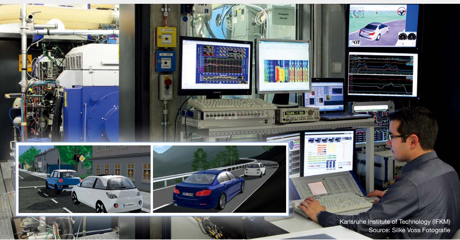
Karlsruhe Institute of Technology (IFKM)